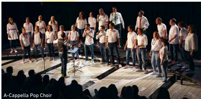
A-Cappella Pop Choir