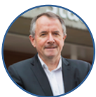
Albert Schweizer Standortförderung bei Stadtverwaltung Schlieren

PS: Dieser Text wurde von einer künstlichen Intelligenz verfasst.